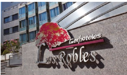
Los Robles Gerhoteles Madrid

Asimismo, gestiona Los Robles Gerhoteles Madrid , una residencia para mayores exclusiva para mutualistas de PSN y profesionales universitarios ubicada en un importante barrio residencial de la capital.