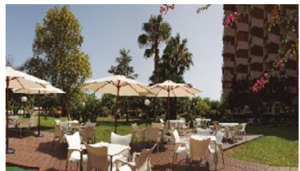
Complejo PSN San Juan